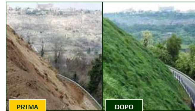
ABBADIA – ORVIETO (TR)