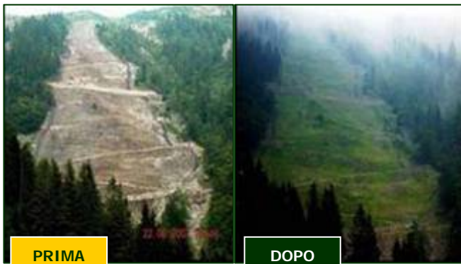
FRANA DI OROPA (BI) – 40.000 mq