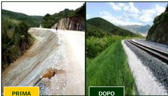
SOLVAY SPA, S. VINCENZO (LI) – 50.000 mq