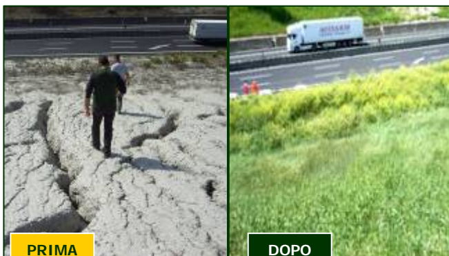
AUTOSTRADIE PER L'ITALIA SPA – FABRO (TR)