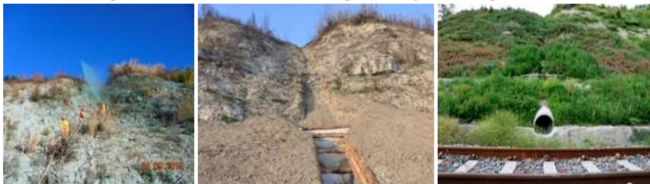
Figura 4. Canaletta inerbita realizzata direttamente su ammassi rocciosi e terre. Si noti la perfetta adattabilità alla conformazione e tipologia del terreno.