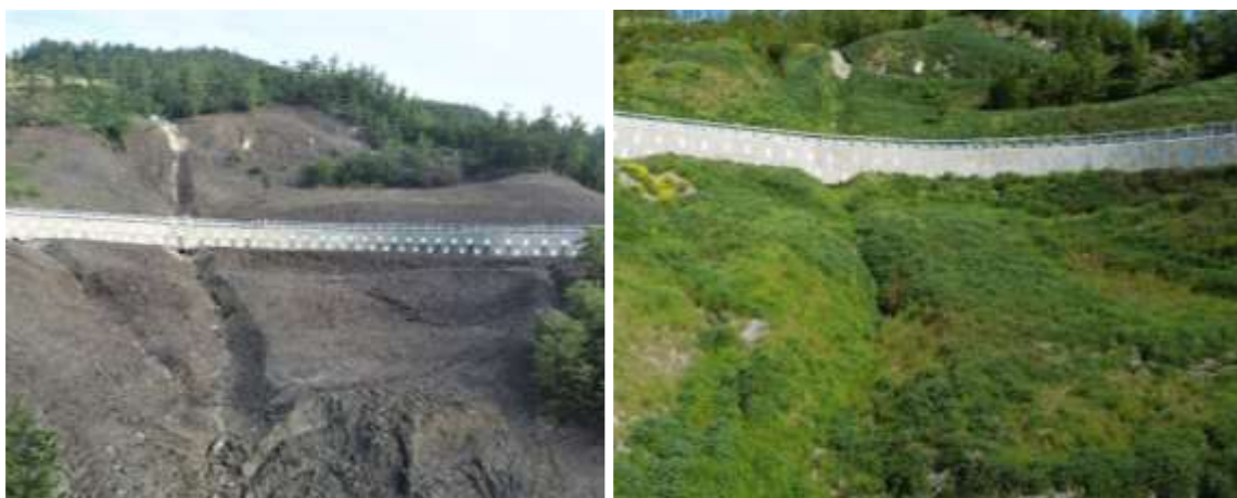
Figura 2. Autostrade per l'Italia, l'impressionante realizzazione antierosiva e di regimentazione delle acque eseguita seguendo le naturali linee di ruccellamento dell'acqua.