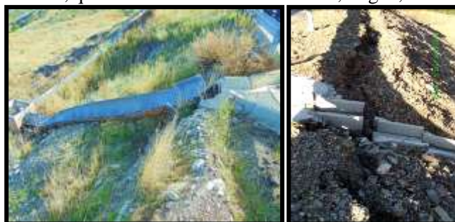
Figura 1. Esempi delle problematiche più comuni delle canalette tradizionali.

Questa innovativa tecnologia consente di realizzare direttamente sul tal quale le opere di captazione e regimentazione delle acque superficiali e meteoriche, eliminando completamente l'uso di materiali e manufatti estranei al litotipo di cui è costituito il versante, quali canalette in cemento e ferro, briglie, embrici, etc. Figura 1