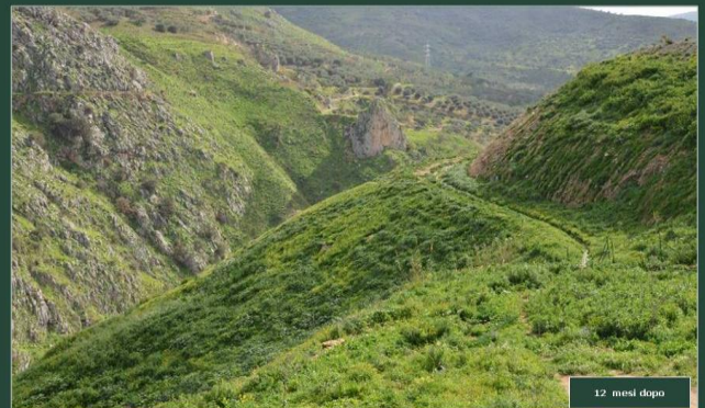
IMPIANTO DI PRATI ARMATI® SU UNA DISCARICA A PENDIO IN SICILIA