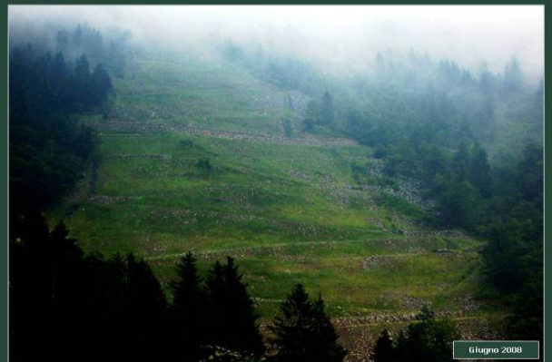
IMPIANTO DI PRATI ARMATI® SULLA FRANA DI OROPA (BI)