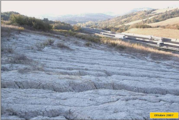
AUTOSTRADA A1 MILANO - NAPOLI

Una delle scarpate in erosione: a dx l'Autostrada A1