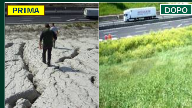
AUTOSTRADE PER L'ITALIA SPA: A1 (NA-MI) Stabilizzazione di un versante in argille plioceniche