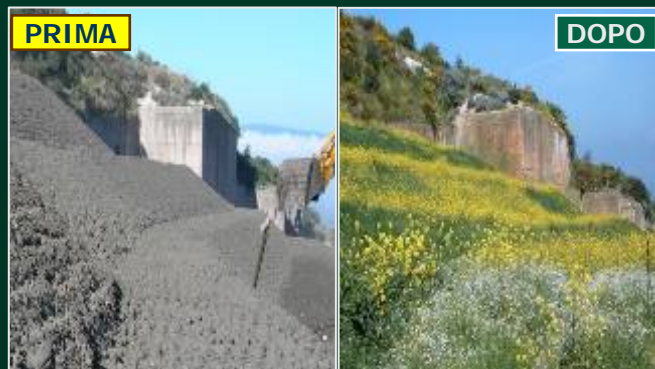
Rinaturalizzazione della discarica RSU di Ozieri (SS)