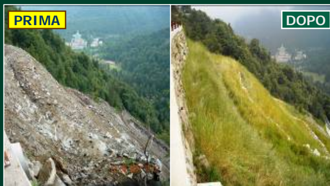
SACRI MONTI DEL PIEMONTE DICHIARATI NEL 2003 PATRIMONIO DELL'UMANITÀ DALL'UNESCO Frana di Oropa caratterizzata da un pendio acclive di alta montagna in depositi detritici