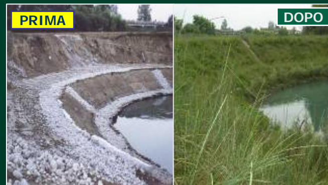
REGIONE FRIULI: PORDENONE Protezione spondale