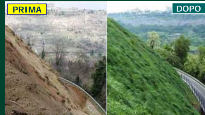
PROVINCIA DI TERNI: ORVIETO Stabilizzazione di un versante in depositi piroclastici