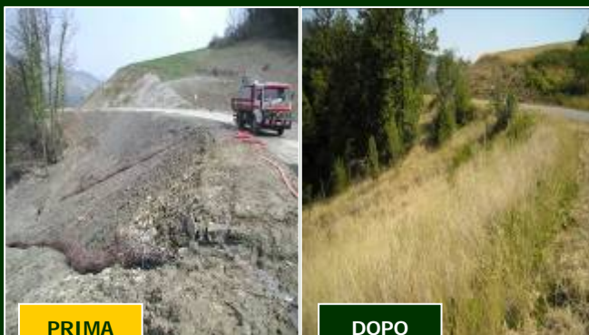
PROVINCIA DI BIELLA: FRANA DI OROPA (BI) 40.000 mq