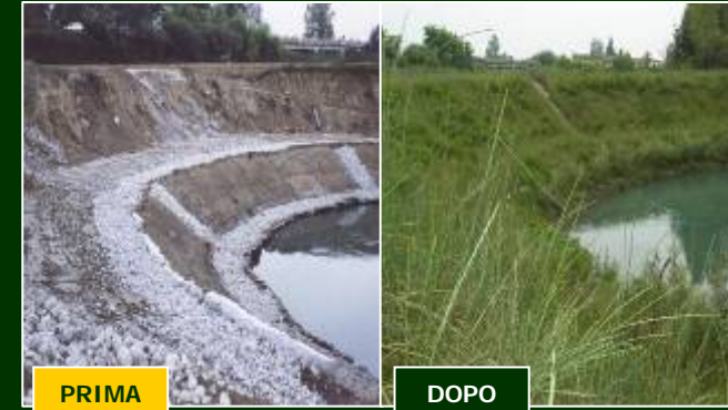
PROVINCIA DI TERNI: ABBADIA – ORVIETO (TR) 10.000 mq