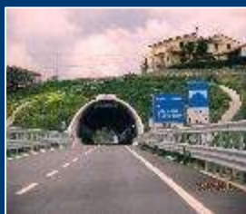
ANAS: SS 106 Jonica Marina di Gioiosa Jonica Cantiere su smarino tal quale

Studi, tesi, ricerche, sperimentazioni compiute presso le principali università italiane e centinaia di cantieri realizzati in Italia e all'estero, che hanno dimostrato che con le piante erbacee perenni autoctone a radicazione profonda, sottile e resistente è possibile contemporaneamente: