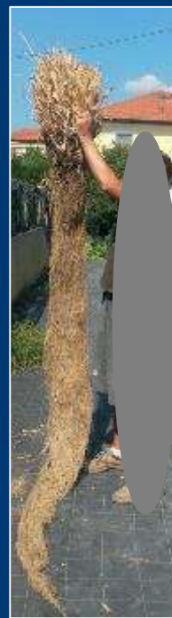
Radice di 3 metri allevata in serra

Verranno inoltre presentate soluzioni sinergiche con tecniche più tradizionali, come reti paramassi a contatto ed altri manufatti e tecnologie innovative.