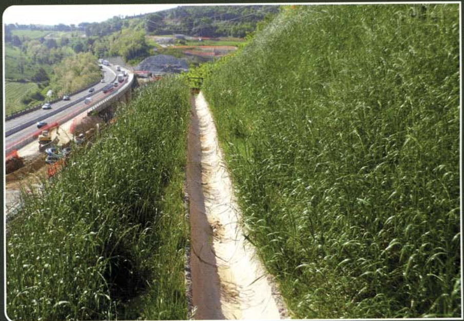
Autostrada Adriatica A14 - Canalette pulite grazie all'azione antierosiva dei PRATI ARMATI®

sono piante erbacee a radicazione profonda che bloccano l'erosione su tutto il versante impedendo che il materiale eroso intasi canalette, fossi di guardia e pozzetti, mantenendoli puliti ed efficienti e annullando i costi di manutenzione.