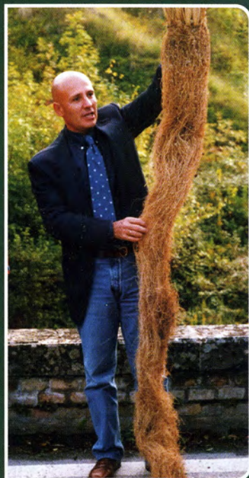
Radice PRATI ARMATI® allevata in serra

SISTEMI ANTIEROSIVI A CONFRONTO: per 1 ettaro meglio usare 1300 tonnellate o 12 tonnellate di materiali?