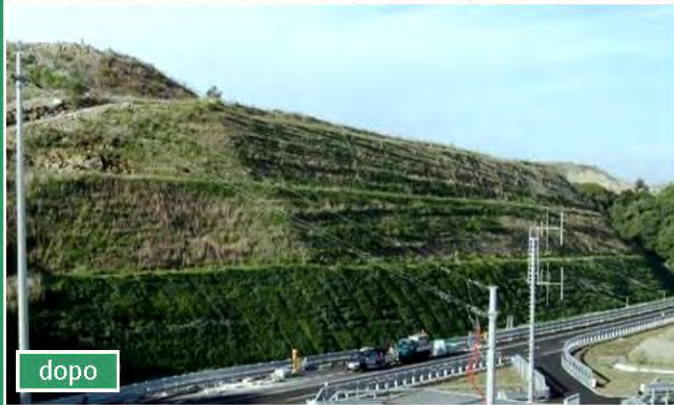
Autostrada CT-SR: conglomerati, calcareniti, argilliti