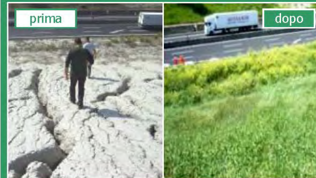
Autostrada del Sole (A1): argille plioceniche sovraconsolidate