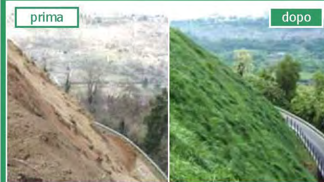
Orvieto (TR): depositi piroclastici disgregati

Ore 17,00 Dibattito e chiusura dei lavori