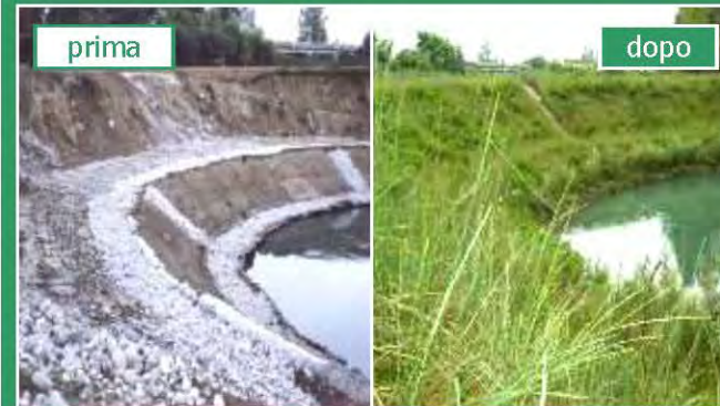
Regione Friuli: protezioni spondali