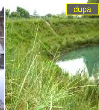
Regiunea Friuli: protejare maluri