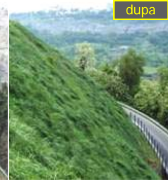
Orvieto (TR): depozite piroclastice dezagregate