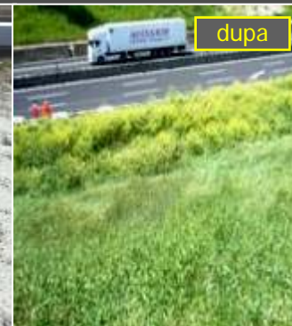
Autostrada Soarelui(A1): teren argilos pliocenic supraconsolidat