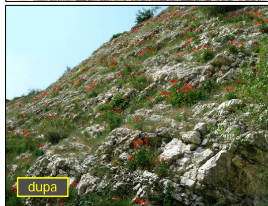
Reabilitare ecologica a unei cariere de calcar - Spoleto