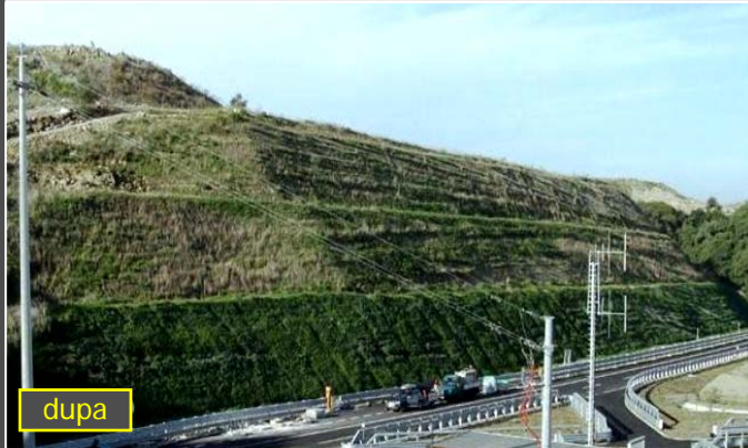
Autostrada Catania - Siracusa: conglomerate calcaroase, argiloase