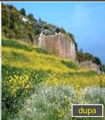
Renaturalizare depozit de deseuri RSU la Ozieri (SS)